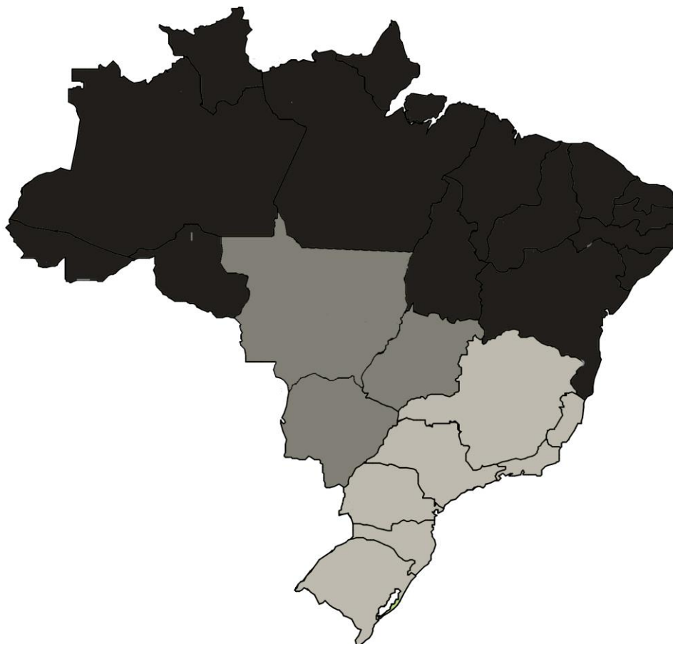
Figura 2 –Distribuição do gene da Hb S nas regiões do Brasil, com valores médios obtidos da tabela 2 referentes à população de cada região analisada.